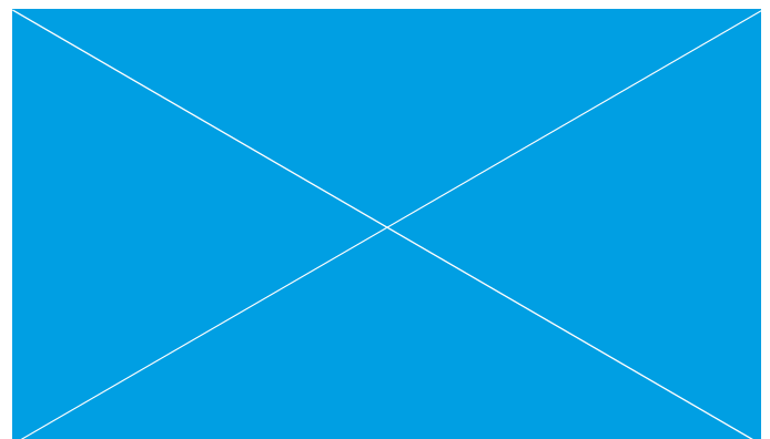
Pie de imagen