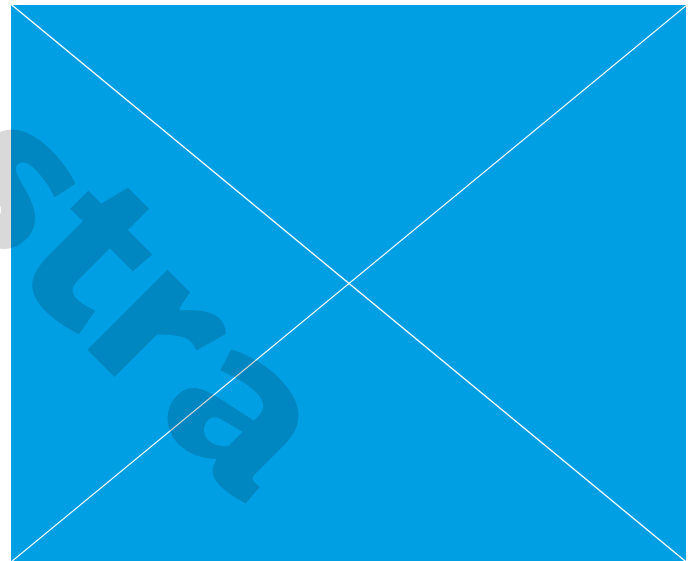
Pie de imagen